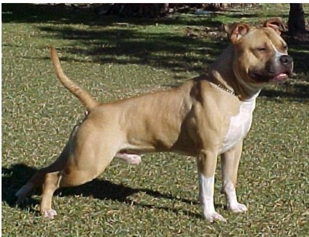
American staffordshire terrier

DILIGÈNCIA: per a fer constar que aquesta Ordenança ha estat aprovada inicialment el dia 15 de març de 2010. L'aprovació definitiva i el text íntegre es publiquen al BOP de Girona núm. 137, de 19 de juliol de 2010. Santa Coloma de Farners, 10 d'agost de 2010 El secretari